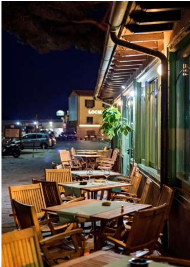
Meer & Weite, Wind & Licht, traumhafte Flora, Landschaft & Leute, alte Bauten & Architektur, Gemütlichkeit und Stimmung mit fotografischen Highlights.